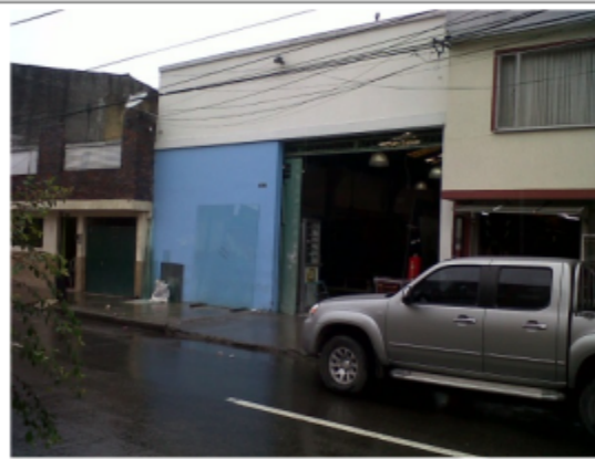
FOTOGRAFÍA 2: FACHADA DEL PREDIO.