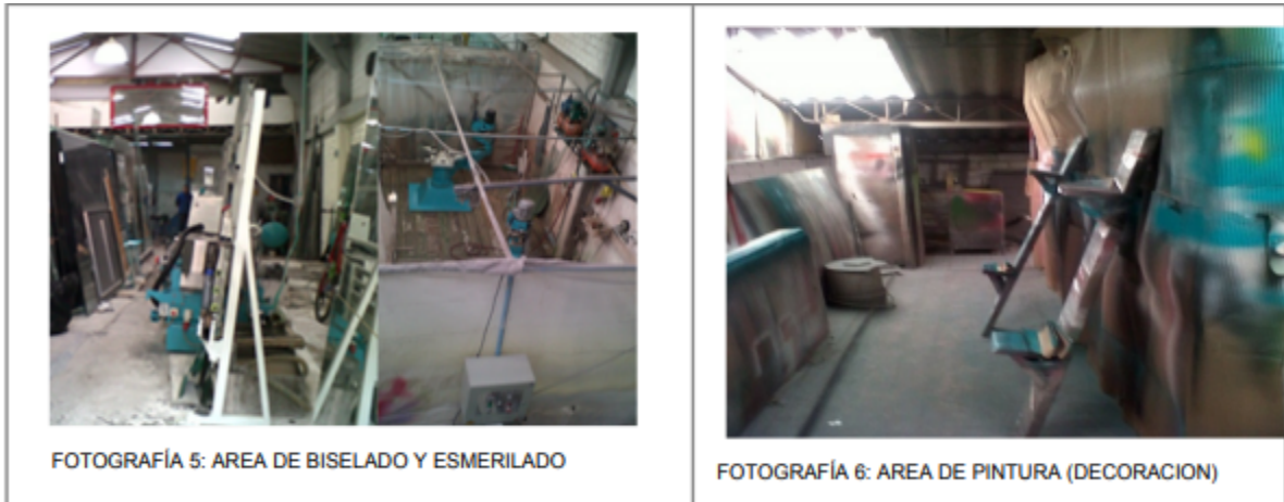
FOTOGRAFÍA 5: AREA DE BISELADO Y ESMERILADO