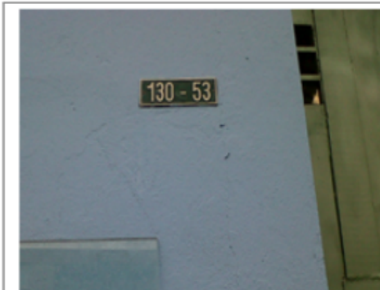
FOTOGRAFÍA 1: NOMENCLATURA.