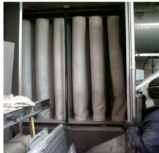
FOTOGRAFÍA 4: SISTEMAS DE CONTROL FILTRO DE MANGAS IMPLEMENTADO EN EL SANDBLASTING.