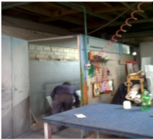
FOTOGRAFÍA 3: CABINA DE SANDBLASTING.